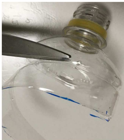
慣れたら斜め上に切りながら鋏を 移動させ、ゆっくり丁寧に切ります