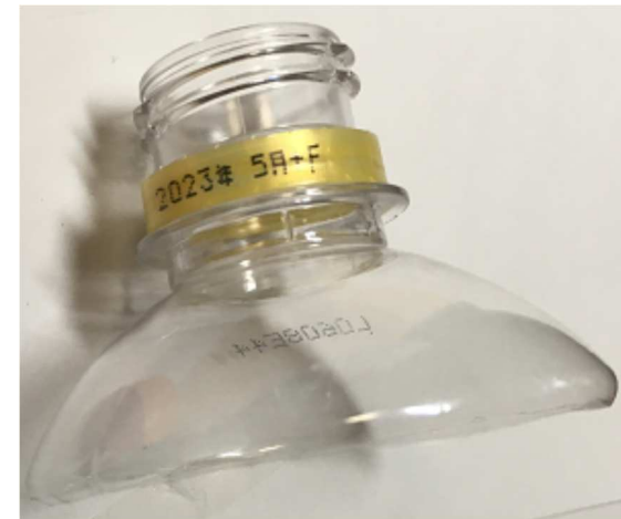
切った所にトゲがあったら鋏で除去して終了 出来上がりは~56cm の高さで